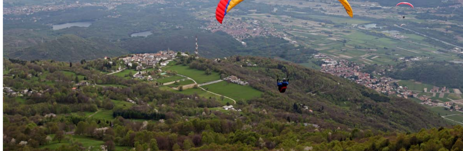
Cima Cavallaria. Auf der Geländeterrasse liegt das Bergdorf Brosso. Cima Cavallaria. Auf der Geländeterrasse liegt das Bergdorf Brosso. | Dies ist ein Typoblindtext. An ihm kann man sehen, ob alle Buchstaben da sind und wie sie aussehen. | Andrate