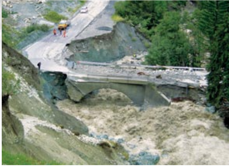
Hochwasserereignis August 2005, Tasnabrücke der Engadinerstrasse bei Ardez.